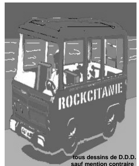
tous dessins de D.D.D. sauf mention contraire

Si ça vous intéresse, vous pouvez bien sûr nous contacter.